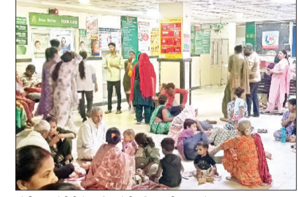
सोनीपत। ओपीडी में फर्श पर बेठी महिला मरीज व बच्चे।

जिला नागरिक अस्पताल में उपचार के लिए आने वाले मरीजों को परेशानी का सामना करने पर मजबूर होना पड़ रहा है। मरीजों को उपचार के लिए लंबी लाइनों में लगने पर मजबूर होना पड़ रहा है। वहीं गर्मी के मौसम के चलते रजिस्ट्रेशन काउंटर के बाहर लाइन में लगने वाले मरीजों को ज्यादा परेशानी हो रही है। रजिस्ट्रेशन काउंटर के बाहर लगे पंखे बंद होने के चलते परेशानी बढ़ गई। वहीं दवाइयां लेने के लिए महिलाओं को परेशानी का सामना करना पड़ रहा है। प्रबंधन की तरफ से डिस्पेंसरी पर एक महिला काउंटर बंद कर दिया है। जिसके चलते लंबी लाइन लग रही है। बता दें कि नागरिक अस्पताल में हर रोज करीब दो हजार के आसपास की ओपीडी संख्या है।