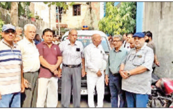
सोनीपत। नेत्रदान और देहदान के लिए मौके पर पहुंचे समिति के पदाधिकारी।