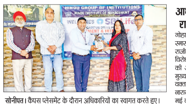
सोनीपत। कैपस प्लेसमेंट के दौरान अधिकारियों का स्वागत करते हुए।