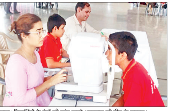
गोहाना। विद्यार्थियों के नेत्रों की जांच करते अस्पताल की टीम के सदस्य।