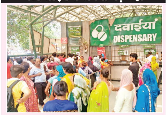
सोनीपत। डिस्पेंसरी के बाहर बंद काउंटर होने के चलते लगी भीड़।

बढ़ती गर्मी के चलते अस्पताल में मरीजों की संख्या बढ़ने लगी है। वहीं लंबी लाइनों में लगकर घंटों बाद उपचार मिलने के बाद महिलाओं को दवाइयों के लिए घंटों लाइन में लगना पड़ रहा है। गत तीन दिनों से डिस्पेंसरी में तैनात एक कर्मचारी की इस्ट्री बदल दी। जिसके चलते एक महिला काउंटर बंद हो गया। काउंटर के बाहर घंटों लंबी लाइन दवा लेने वालों की लगी रहती है।