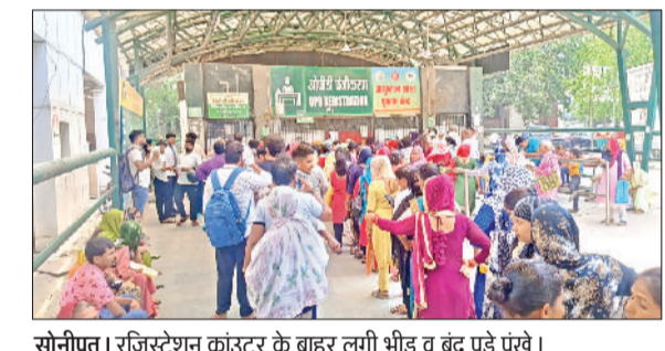
सोनीपत। रजिस्ट्रेशन काउंटर के बाहर लगी भीड़ व बंद पड़े पंखे।